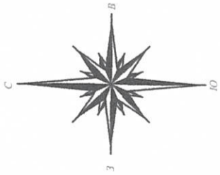
Схема планировочной организации земельного участка Площадь участка - 470,0 кв.м