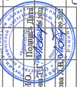
Схема планировочной организации земельного участка под строительство индивидуального жилого дома по адресу: Ростовская область, Аксайский район, г. Аксай, ул. Советская, 31